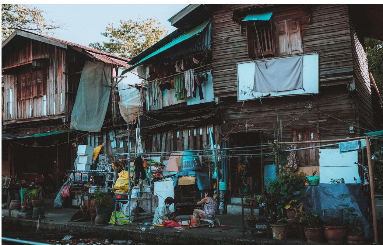
Mulheres sentadas na calçada, Maksim Romashkin, 2022. Fonte: Pexels.