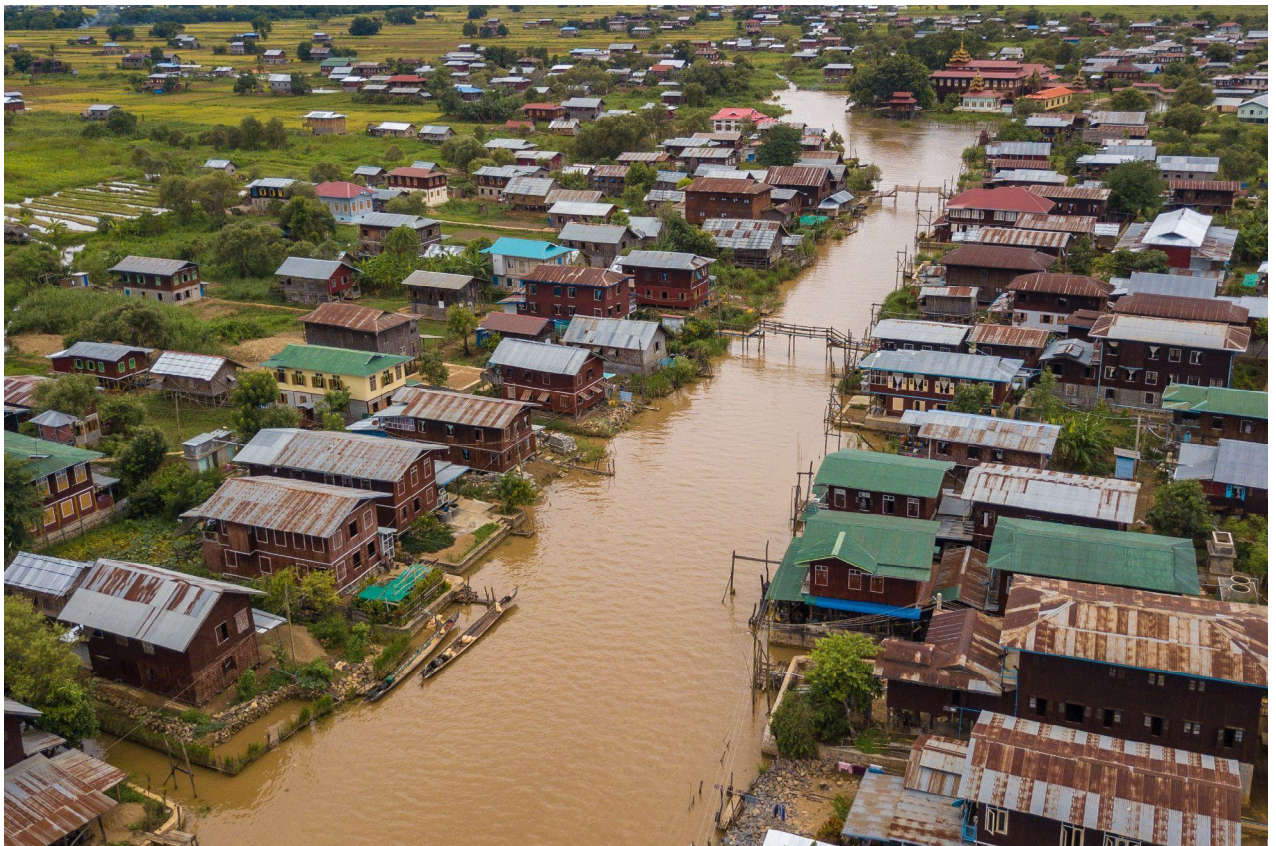
Fotografia aérea, Tony Wu, 2021. Fonte: Pexels.