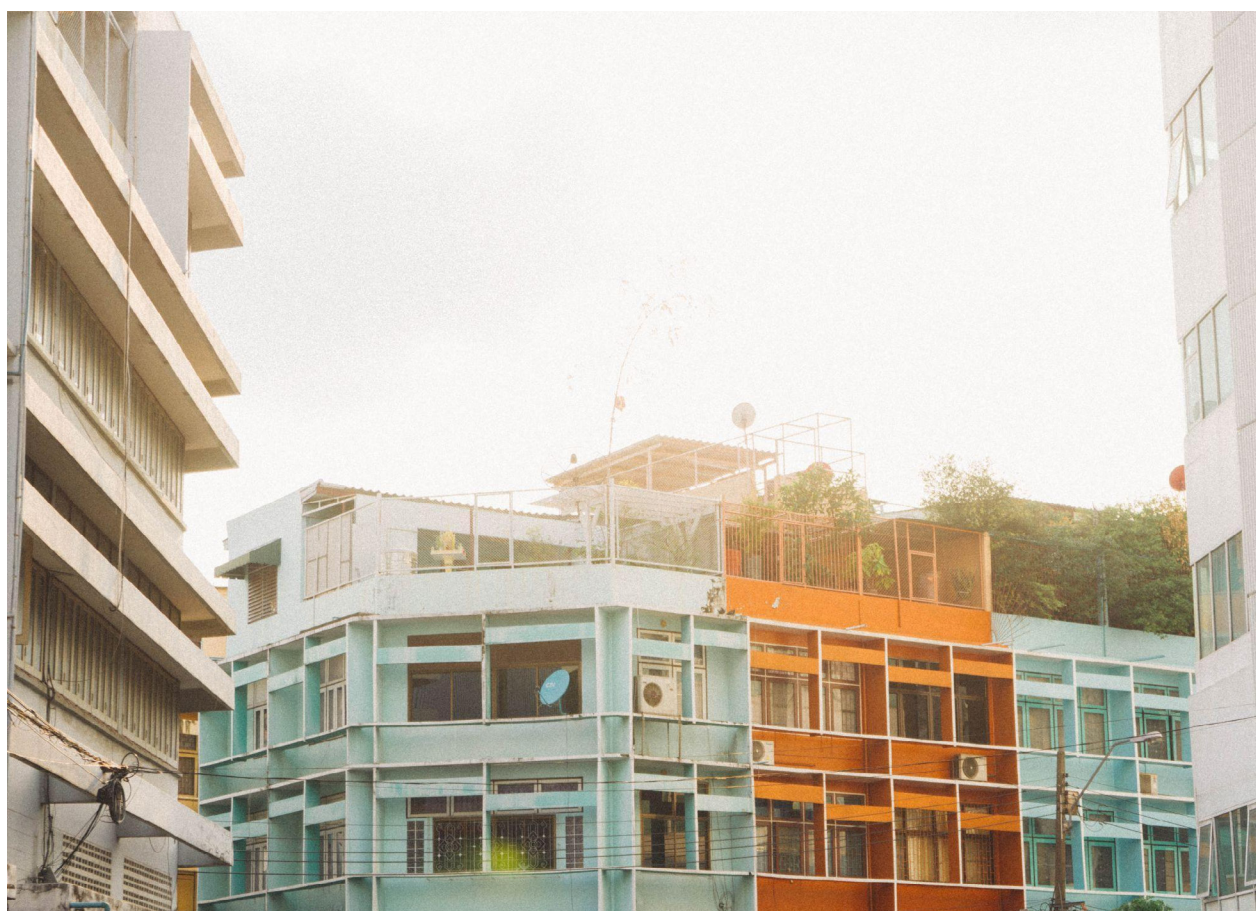
Edifício de concreto perto de árvores, Martin Péchy, 2019. Fonte: Pexels.