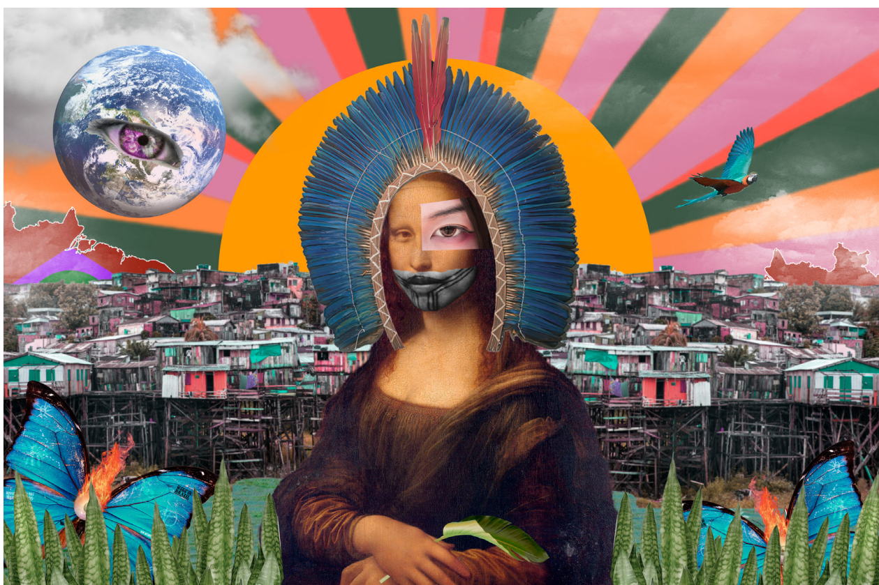
Monalisa da Amazônia. Raket Caminha. 2021.

“...Dizem que o futuro do mundo é aqui Dizem que a garganta do mundo é aqui Que o grito do mundo das águas é aqui Dizem que o canal do mundo é aqui Dizem que o quintal do mundo é aqui Que o hospital do mundo é aqui Dizem que o mistério do mundo é aqui Dizem que o celeiro do mundo é aqui Que o grito das bocas profundas é aqui...”